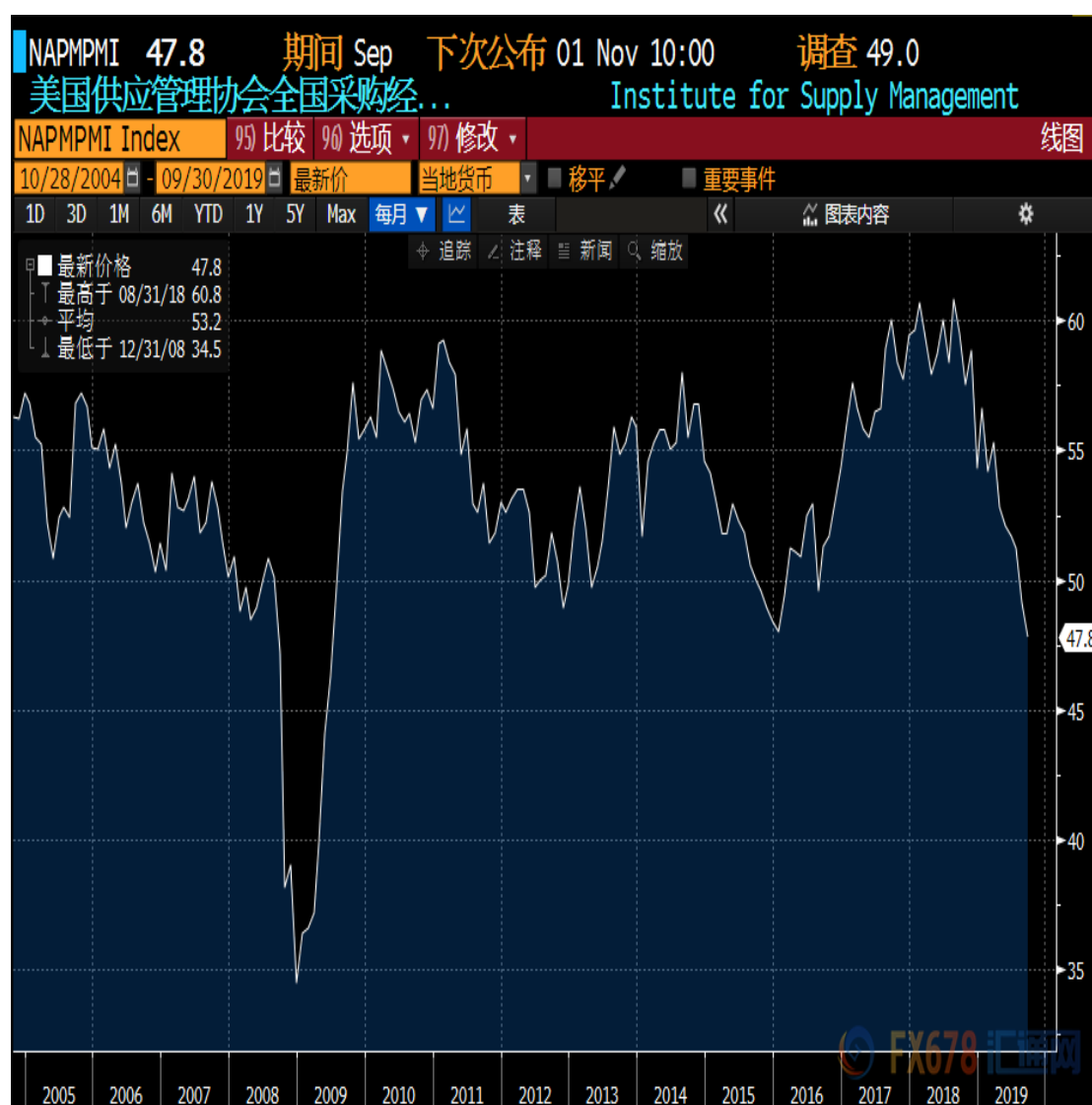
(美国 ISM 制造业 PMI 数据历史表现一览)

周五还需重点关注的是美国 10 月 ISM 制造业 PMI 数据，9 月份该数据曾录得逾十年最差表现，对美元拖累明显。目前市场预计会略微有所改善至 49，有望在数据出炉前给美元提供一些支撑；但由于仍可能维持在荣枯分界线 50 下方，投资者仍需予以警惕。